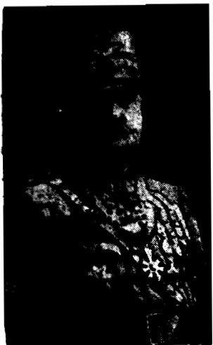
gen. GONZAQA królowi Mussolini odebrał dowództwo milicji faszystowskiej za jej wystąpienie przeciw armii królewskiej