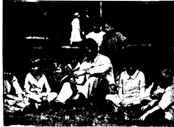
Wannaz bardzo chętnie przebywa w towarzystwie dzieci i opowiada im o swoich przygodach.