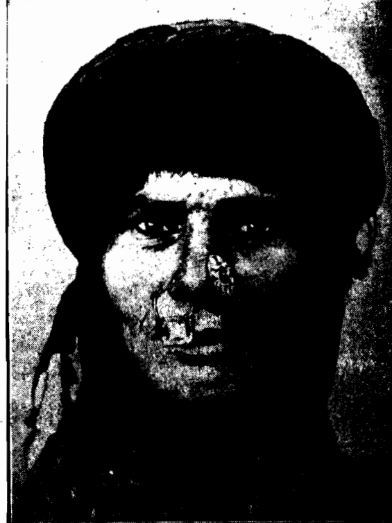
Włoczek pustyni arabskiej, której nie wystarczają kolczyki w uszach, nosi je jeszcze w nosie.