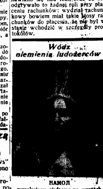
HAMON wynaleziony niedawno na wyspach australijskich