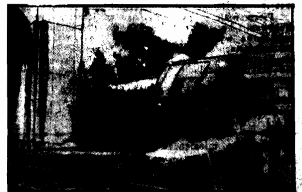
Włoczek niemieckiej stacji Lebnitz wykolejona lokomotywa rozbijała się o mur.