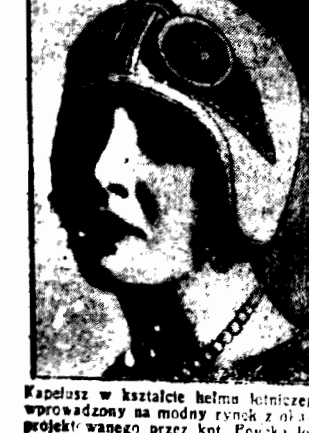
Kapelusz w kształcie helmu lotniczego wprowadzony na modny rynek z okazji projektu wanoz przez kot. Panna lotniczka przez ocean Atlantyki

80 pokoi w hotelu i przeznaczono złotą zastawę stołową.